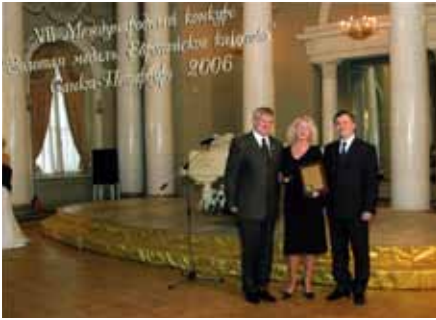
◆ В Санкт-Петербурге после вручения награды, 2006