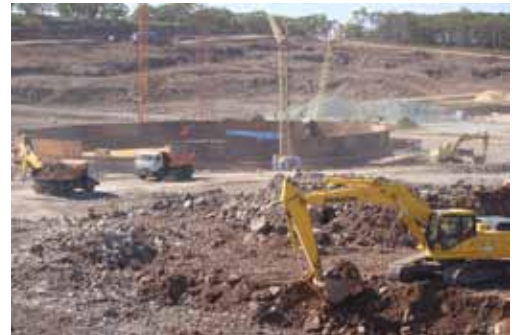
◆ Идет строительство нефтеплощадки в Козьмино, 2009