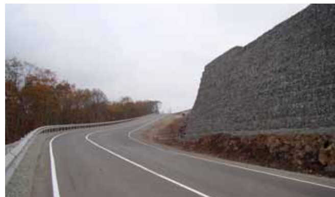
◆ Новая дорога в Козьмино, 2009

Сегодняшний «Комплекс» — это 430 работников, 185 единиц строительной техники, 16,3 га территории, ремонтная база и служебно-бытовые помещения. За последние два года парк машин и механизмов обновлен на 70 процентов. В целом это весомая «единица» экономического потенциала не только города Находки, Приморского края, но и всего Дальневосточного региона.